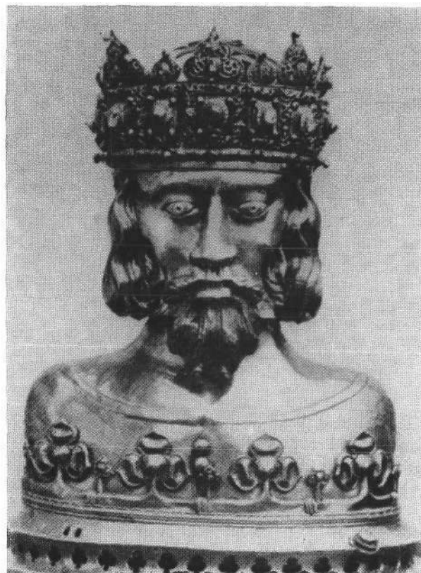
Abb. 2 Büstenreliquiar des hl. Sigismund Schatzkammer in Plozk